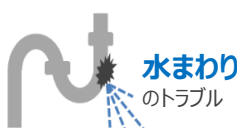
水まわりのトラブル